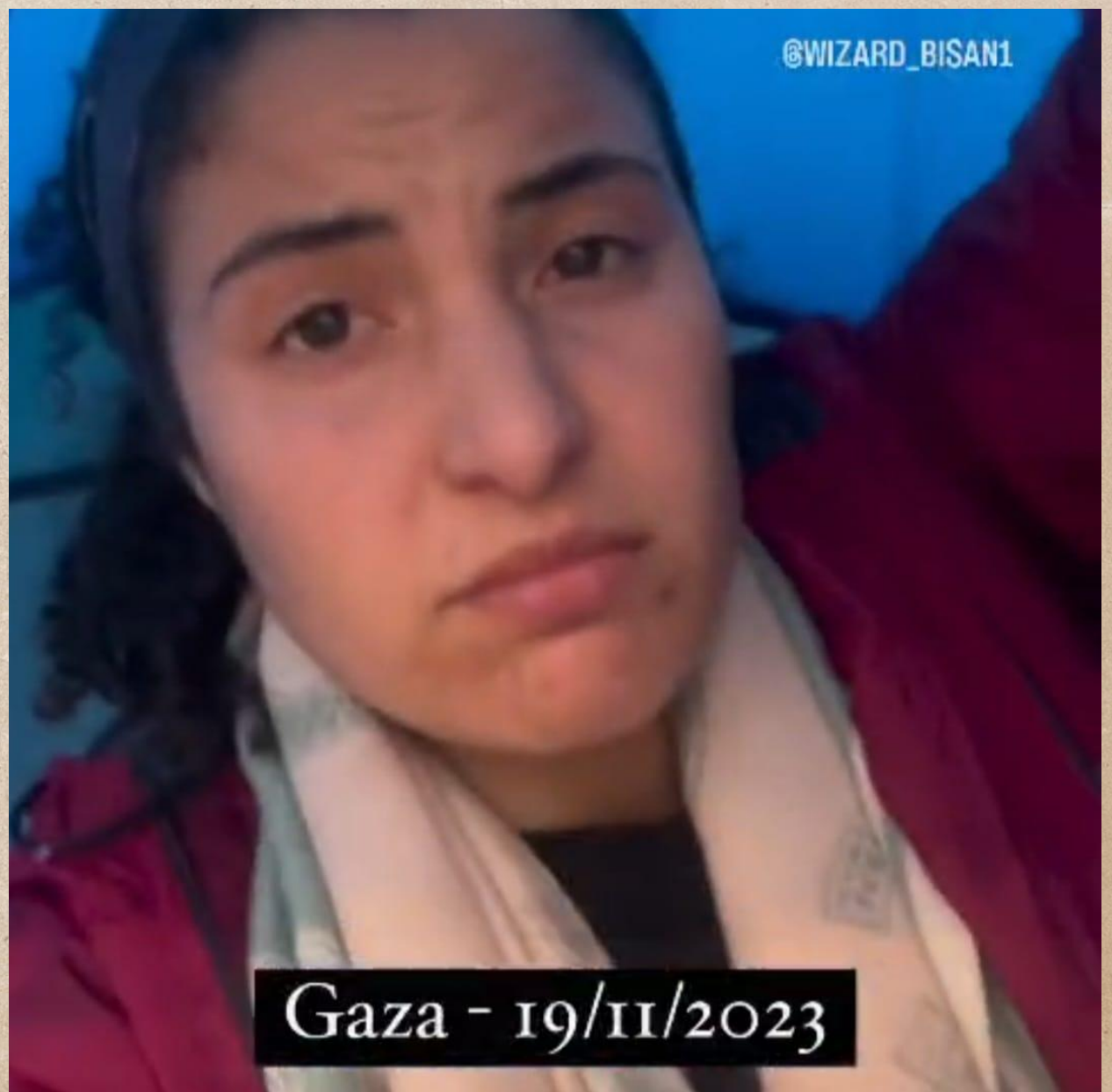
Bisan, en journalist från Gaza beskriver hur tusentals människor saknar skydd från kylan.

En flicka som långsamt börjar känna kylan, hon känner hur den blir värre varje natt. Hon kanske inte vet hur många dagar det har gått, eller vad det är för datum, men hon vet att vintern närmar sig, och hon längtar inte efter den.