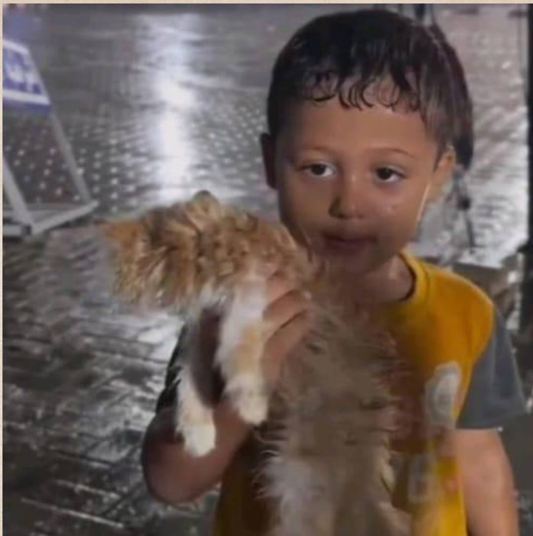
En lättklädd pojke i Gaza med sin katt.

Han längtar verkligen inte till vintern.