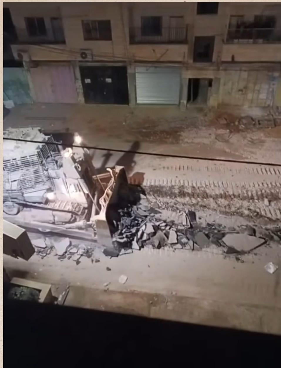
En israelisk schaktmaskin förstör vägar i Jenin, Västbanken

Dessa attacker, hot, mord, förstöring av egendomar har nu fördubblats, och Israel tar upp mer och mer områden av Västbanken.