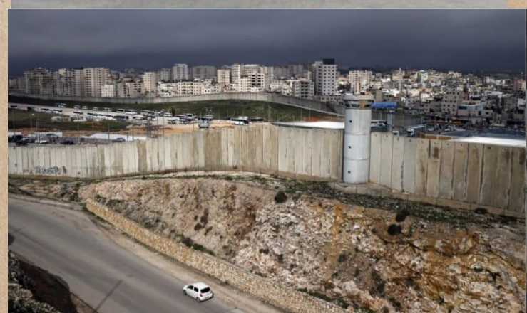
Separations Väggen, Västbanken