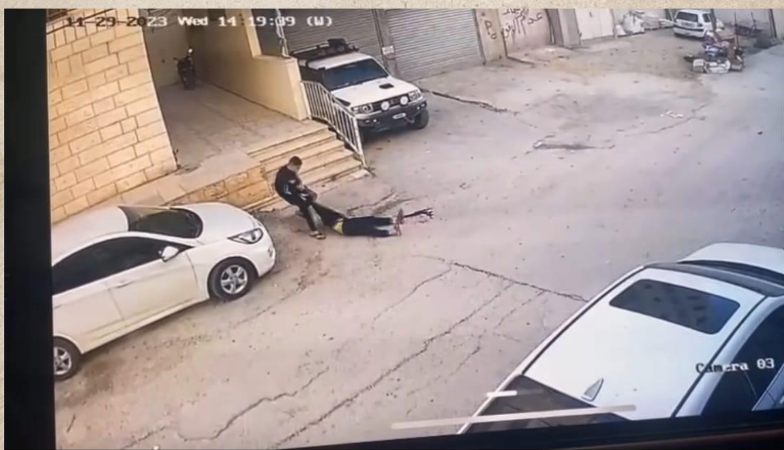
En pojke som drar en annan pojke (9 år) till sidan av vägen efter att han sköts till döds av israeliska ockupationsstyrkor i Jenin, Västbanken

Palestinierna behöver inte föreställa sig.