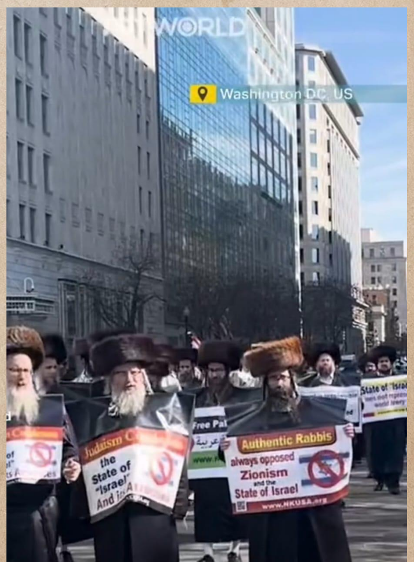
Pro-Palestinska Judar som går ut på demonstrationer mot sionism, i Washington, USA

Israels regering stöttar detta (de var ändå de som uppfann denna rätt) genom att bland annat erbjuda lägre skatt och enklare lån, samt att alltid försvara bosättarna.