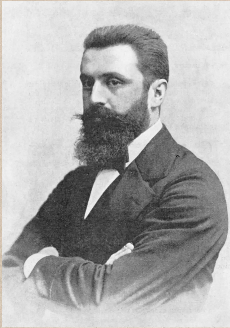
Theodor Herzl (1860-1904), fadern av sionism.

OBS! Denna text är bara en överblick och går inte in i detaljer om det palestinska lidandet. Syftet är att du ska veta att oktober den sjunde är bara ett datum, inte en start