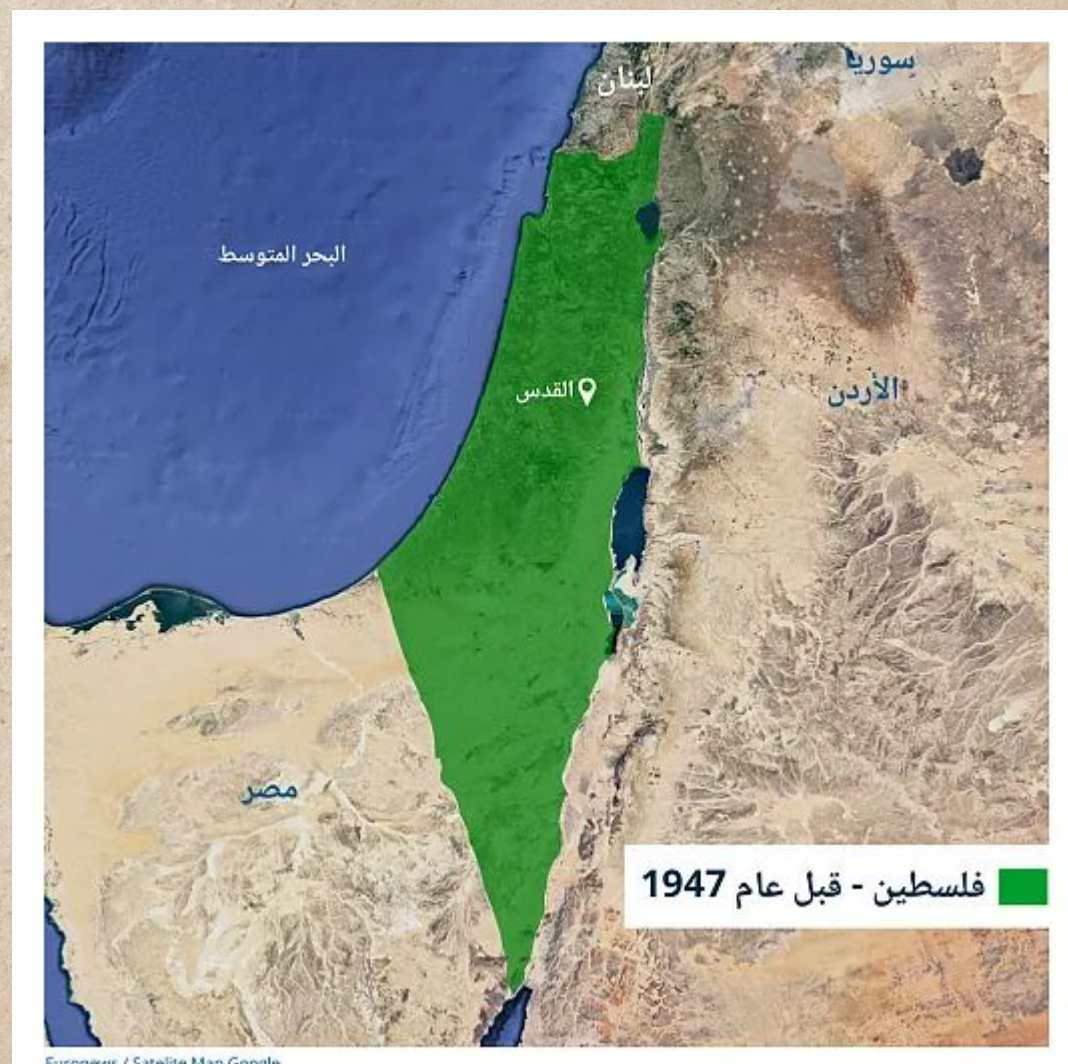
Palestina före 1947

Det är här den Brittiska regionen kommer in i historien - Ta-Da! Överraskning! Inte? Meh.