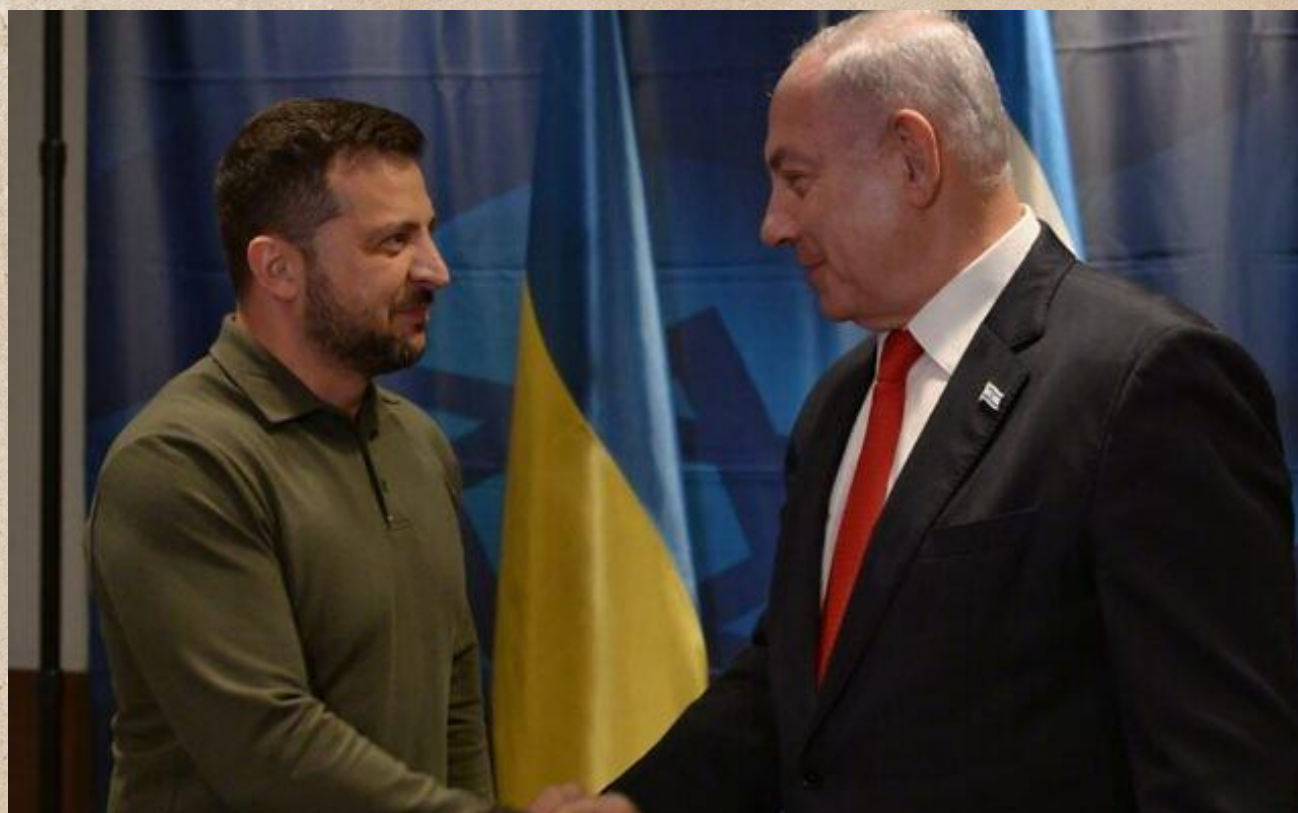
Volodymyr Zelensky och Benjamin Netanyahu.