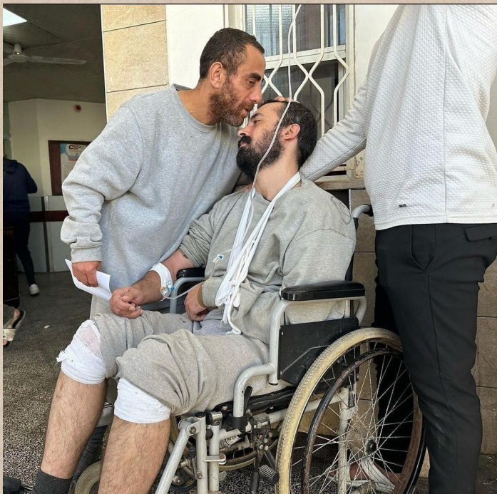
En av de palestinska fångarna från Gaza som släpptes ut efter att ha varit häktade och torterade av israeliska ockupationsstyrkor i veckor (19/01/2024).

Alltså barnens familjer utpressas, trakasseras och drabbas svårt ekonomiskt. Summan familjen måste betala för att få tillbaka sitt barn når upp till 11 500 kr om inte mer, utan hänsyn till familjens ekonomiska situation, vilket gör att familjerna måste ge upp viktiga behov för att kunna ha råd med att befria barnet.