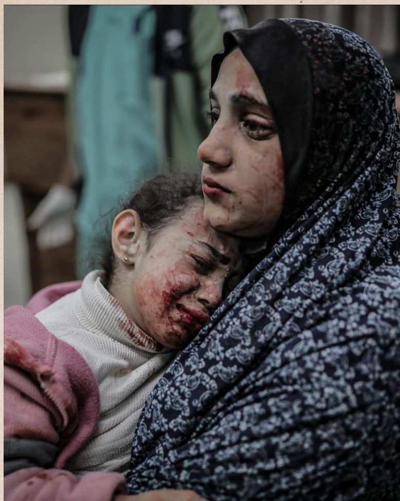
En skadad mamma och hennes dotter efter att deras hus bombades i västra khan younis.

Dessutom, som resultat av den pågående konflikten, har vissa gruppers missnöje med regeringen ökat. En central sådan grupp är de anhöriga till Hamas gisslan, som uttrycker sitt missnöje med att premiärministern inte accepterar villkor för permanent vapenvila som motsvarar frisläppningen av de anhållna.